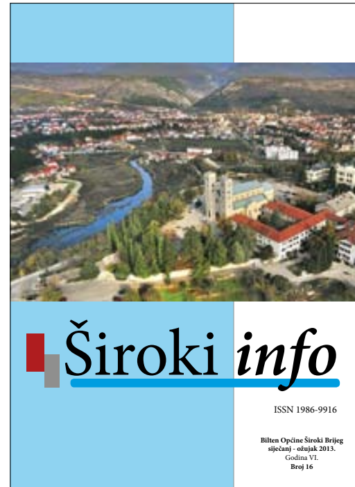
Informativni bilten Općine Široki Brijeg „Široki info“

Javna poduzeća i ustanove dužne su najmanje jednom godišnje podnijeti izvješće o svom radu. (iz Statuta općine Široki Brijeg, Službeni glasnik Općine Široki Brijeg broj: 4/08 i 5/12, www.sirokibrijeg.ba )