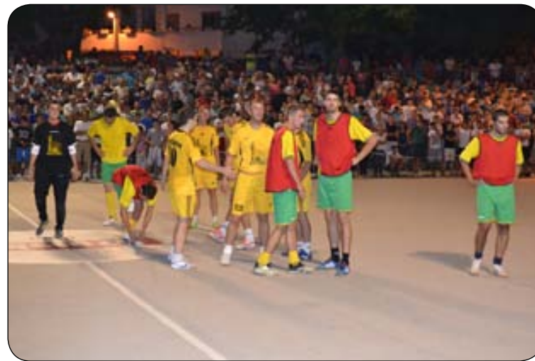
Detalj s malonogometne lige MZ 2012.