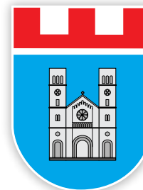
Grb Općine Široki Brijeg