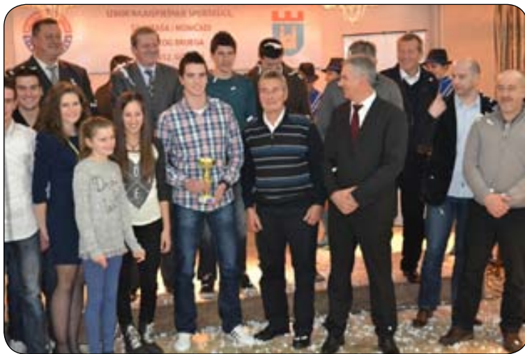
Detalj s izbora najuspješnijih sportaša Općine Široki Brijeg za 2012.