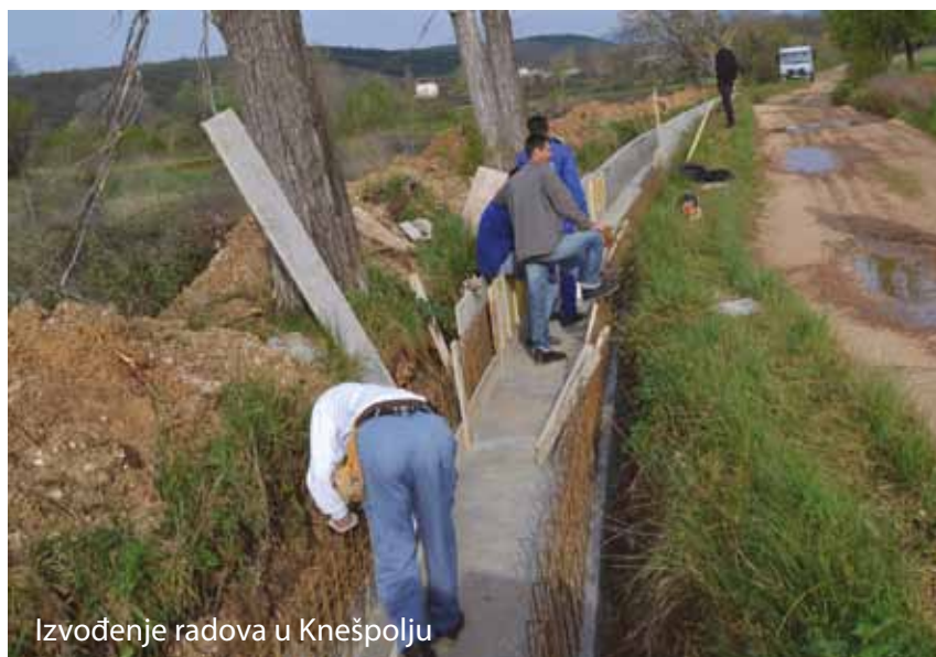
Izvođenje radova u Knešpolju

KORISNIKA VODE DONJA TERASA (kanal prema Biograca), UDRUGA KORISNIKA VODE KNEŠPOLJE, UDRUGA KORISNIKA VODE GORNJA TERASA (kanal prema Turčinovićima), UDRUGA KORISNIKA VODE KANALA DOBRIČ i UDRUGA KORISNIKA KANALA OROVNIK I GORNJI BORAK. Ispred Općine Široki Brijeg je u sklopu priprema ovog projekta predloženo i planirano proširenje sustava za navodnjavanje na područje Ljutog Doca. Do sada je za taj dio sustava izrađeno i odabrano projektno rješenje, a mogućnost