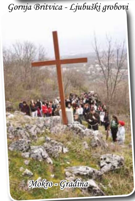
Mokro - Gradina