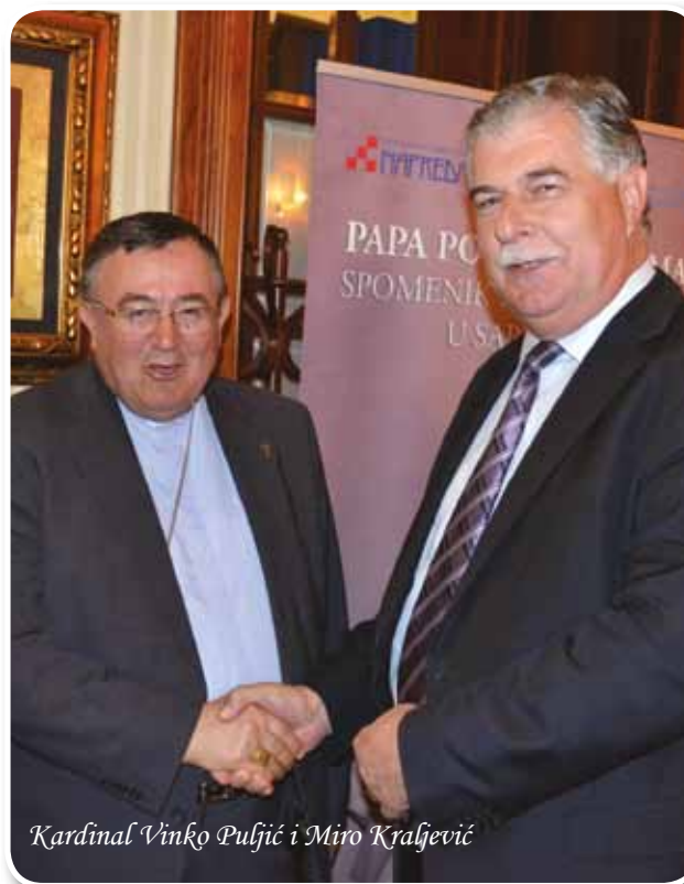
Kardinal Vinko Puljić i Miro Kraljević

Općinski načelnik Miro Kraljević sudjelovao je na donatorskoj večeri organiziranoj, 4. travnja, s ciljem prikupljanja sredstava za izgradnju spomenika blaženom papi Ivanu Pavlu II. u Sarajevu, koji će biti postavljen ispred katedrale Srca Isusova, održanoj u organizaciji Vrhbosanske nadbiskupije i Hrvatskog kulturnog društva "Napredak". Donatorska večer okupila je brojne uzvanike i predstavnike političkog, društvenog i kulturnog života u BiH, te diplomatskog zbora u BiH. Prigodnim govorima o značaju podizanja spomenika papi Ivanu Pavlu II. u Sarajevu prisutnima su se obratili nadbiskup vrhbosanski kardinal Vinko Puljić, predsjednik HKD "Napredak" Franjo Topić, predsjedavajući Predsjedništva BiH Bakir Izetbegović, te predsjedavajući Vijeća ministara BiH Vjekoslav Bevanda. Kardinal Puljić u svom govoru se između ostalog prisjetio papinih riječi na kraju njegovog pohoda u BiH "Ostat ću s vama", naglasivši da će upravo to i biti ostvareno izgradnjom spomenika čiji će cilj biti poruka mira. Spomenik blaženog pape Ivana Pavla II. bit će otkriven 30. travnja 2014.