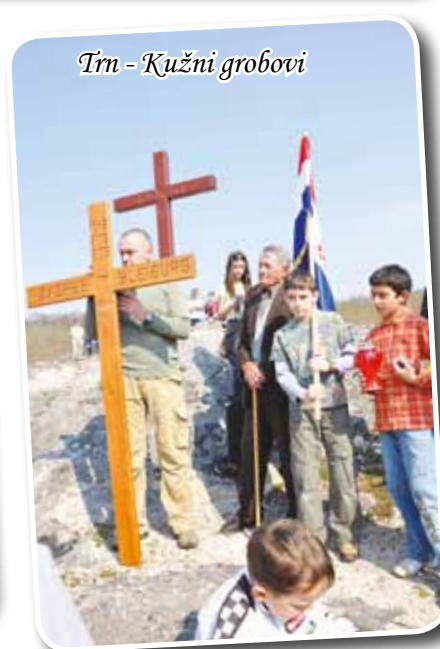
Trn - Kužni grobovi