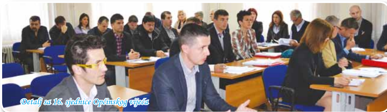
Detalj sa 16. sjednice Općinskog vijeća