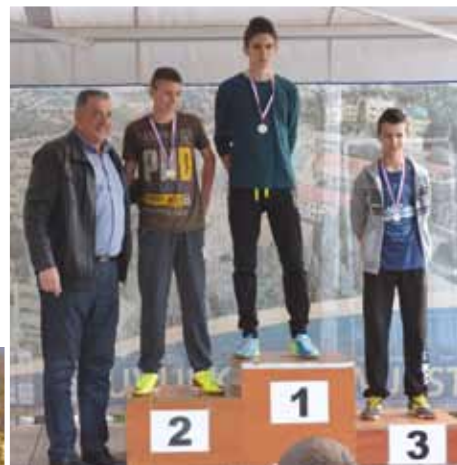
kategoriji 7. i 8. razreda