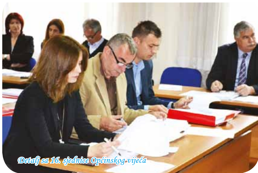
Detalj sa 16. sjednice Općinskog vijeća