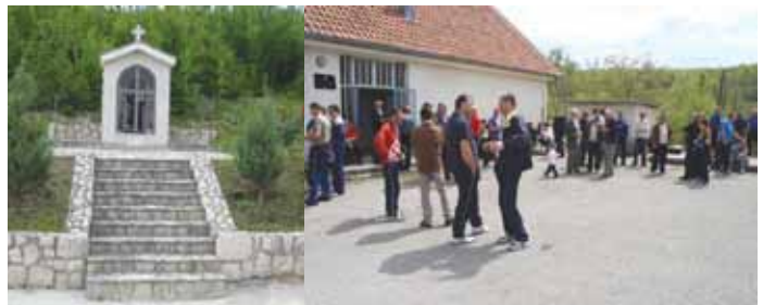
Tradicionalne okupljanje Crnolokvana ove godine je održano na Uskršni ponedjeljak

Ispred škole u Crnim Lokvama, mjesnoj zajednici s najmanje žitelja u Općini Široki Brijeg, na Uskršni ponedjeljak organizirano je okupljanje Crnolokvana koji su za Uskršne blagdane došli iz svih krajeva svijeta. Na ovom tradicionalnom okupljanju bilo je nazočno preko 150 Crnolokvana i njihovih gostiju među kojima su bili i Općinski načelnik Miro Kraljević i predsjednik Vlade Županije Zapadnohercegovačke Zdenko Čosić sa suradnicima. Vrijedni organizatori su uz sada već tradicionalno odlični kuhani grah s kobasicama, pripremili i lešo janjetinu i teletinu kao i roštilj uz domaće vino i pivo.