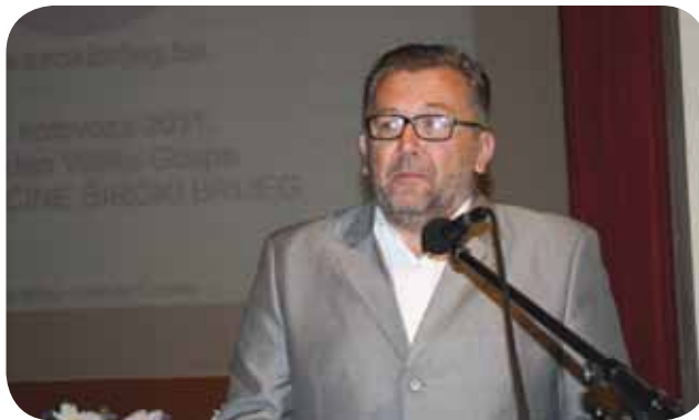
Velimir Pleša, generalni konzul Republike Hrvatske u Mostaru