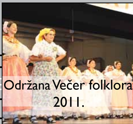
Održana Večer folklor 2011.

Bilten općine Široki Brijeg • listopad - prosinac 2011. • Godina IV • Broj II