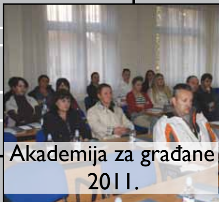
Akademija za građane 2011.