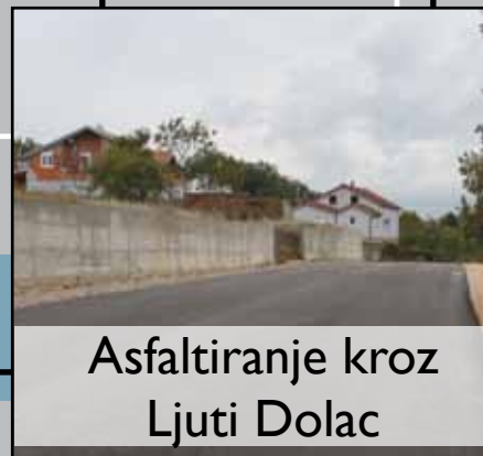
Asfaltiranje kroz Ljuti Dolac