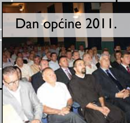
Dan općine 2011.