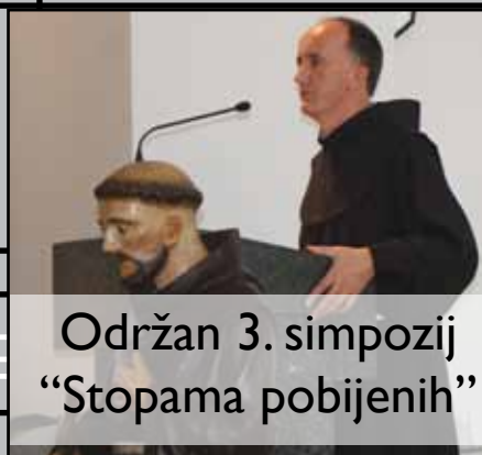
Održan 3. simpozij "Stopama pobijenih"