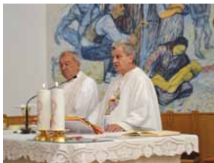
Crkva Stjepana Prvomučenika u Gorici

U povodu obilježavanja 19. obljetnice osnutka Hrvatske Republike Herceg Bosne 28. kolovoza 2012. u crkvi Stjepana Prvomučenika u Gorici služena je sveta misa za Prvog predsjednika HR Herceg Bosne magistra Mate Bobana i za sve poginule i umrle hrvatske rodoljube. Misno slavlje je predvodio fra Nikola Spužević kapelan u župi Gorica-Sovići. Nakon mise izaslanstvo Hrvatskog narodnog sabora predvođeno predsjednikom dr. Draganom Čovićem položilo je vijenac i zapalilo svijeće na grobu Prvog predsjednika HR Herceg Bosne magistra Mate Bobana. Evocirajući uspomene i sjećanje na dane ponosa i slave osnivanja HR Herceg Bosne prije 19 godina prof. Jozo Marić u svom obraćanju nazočnima zapitao se „gdje su naši arhivi, muzeji i kazališta, ali nisu za sve krivi neki drugi i mi smo krivi” rekao je prof. Marić i nastavio „stoga se moramo vratiti izvornim načelima Hrvatske zajednice i Hrvatske Republike Herceg Bosne i na izborima koji su pred nama izabrati najbolje”. Obilježavanju 19. obljetnice osnutka Hrvatske Republike Herceg Bosne nazočili su i predsjednik i tajnik Općinskog odbora HDZ-a BiH Široki Brijeg Miro Kraljević i Dario Knezović. U poslijepodnevnom satima ispred spomenika hrvatskim braniteljima na Rondou u Mostaru u povodu obilježavanja 19. obljetnice od osnutka Hrvatske Republike Herceg Bosne položen je vijenac i zapaljene svijeće za sve poginule i umrle hrvatske rodoljube.