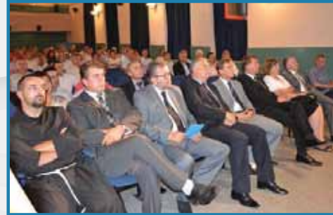
SVEČANO OBILJEŽEN DAN OPĆINE I BLAGDAN VELIKE GOSPE