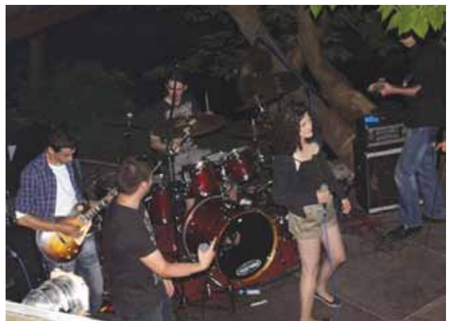
S promocije albuma "Berette"