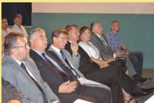
Detalj sa svečane sjednice Općinskog vijeća