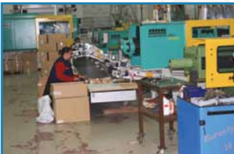
PREDSTAVLJAMO TEM MANDEKS