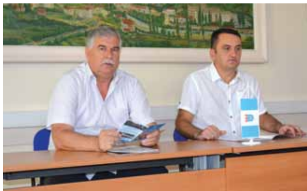
Detalj s konferencije za novinare Općinskog načelnika

„U proteklom razdoblju ustrajno smo radili na pripremi niza projekata, tražili i iznalazili načina za nastavak realizacije započetih kapitalnih projekata. Izdvojiti ću nastavak izgradnje Osnovne škole na Lisama za koju nam je dio sredstava osigurala Vlada ŽZH. Zatim izgradnja prometnice kod Doma zdravlja kojom će se poboljšati pristup Hitnoj pomoći i smanjiti poteškoće u prometu ulicom dr. Jure Grubišića, a rekonstruirat ćemo i asfaltirati „Kruninu stranu“. U sklopu izgradnje novog gradskog autobusnog kolodvora uskoro ćemo započeti s radovima rekonstrukcije i uređenja prometnica i partera, a nakon toga nastaviti i s izgradnjom samog objekta. Nastavljamo s kontinuiranim radom na projektima vodoopskrbe po selima i mjesnim zajednicama, a projekt rekonstrukcije i proširenja sustava za navodnjavanje je odobren od Svjetske banke u fazi je pripreme tenderske dokumentacije nakon čega će biti raspisan natječaj za odabir izvođača radova vrijednih 5 milijuna KM. Ovaj za nas vrlo važan projekt će financirati Svjetska banka, a njegovom realizacijom će se značajno povećati mogućnost natapanja zemljišta kao preduvjet povećanja poljoprivredne proizvodnje. I u protekloj godini bili smo svjedoci velikih uspjeha širokobrijeških športaša koji su na najbolji način promovirali naš grad, a bili smo i svjedoci brojnih kulturno-zabavnih događaja u našem gradu”, rekao je između ostalog načelnik Kraljević.