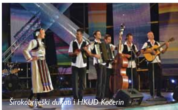
Širokobriješki dukati i HKUD Kočerini

Tri od 22 skladbe na 17. Hrvatskom glazbenom festivalu „Etnofest Neum 2012.“, održanom 19. kolovoza, na platou hotela „Zenit“ uz samu obalu mora, izveli su širokobriješki glazbenici. Nastupili su „Širokobriješki dukati“ i HKUD „Kočerini“ s pjesmom Sve behara i sve cvjeta, Zdenko Damjanović i HKUD „Blaćani“ izveli su pjesmu Trebinja, a Ine Tadić & Hercegovački bećari opjevali su Blaćanku. Posebne ovacije preko više od 1.500 oduševljenih posjetitelja cijele neumske rive dobio je duet Mate Bulić i Maja Šuput, koji su izveli pjesmu „Dvije lude“, Dario Plevnik i KUD „Tamburica“ s pjesmom „Rajska Djevo“, a publiku je scenskom izvedbom i koreografijom na pozornici oduševio Mario Rucner. Još su nastupili i Livio Morosin, Teška industrija, Željko Krušlin Kruška, Ivana Banfić, Trio Gušt, Dražen Žanko, Slavonski dukati... Festival je izravno prenosio BHRT, a snimka festivala prikazana je na glazbenom kanalu CMC-Croatian Music Channel, kao i na lokalnim TV postajama.