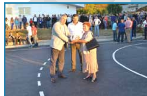
SVEČANO OTVORENO IGRALIŠTE U PRIVALJU