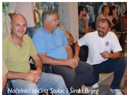
Načelnici općina Stolac i Široki Brijeg