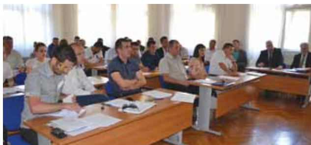
Detalj sa sjednice Općinskog vijeća