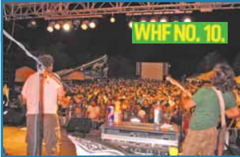
10. WEST HERZEGOWINA FEST (WHF) 3.-5. KOLOVOZA

Bilten općine Široki Brijeg • listopad - prosinac 2012. • Godina V • Broj 15