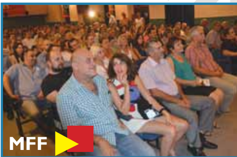
13. MEDITERAN FILM FESTIVAL (MFF) 20.-25. KOLOVOZA