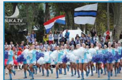
USPJEŠAN NASTUP ŠIROKOBRIJEŠKIH MAŽORETKINJA NA EUROPSKOM PRVENSTVU