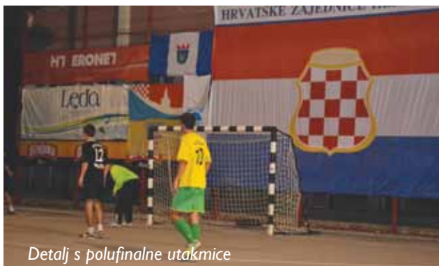
Detalj s polufinalne utakmice

U polufinalu Lige Hercegovine igranom na školskom igralištu u Stocu 31. kolovoza ekipa Ljutog Doca poražena je od Meljakuše (Posušje) rezultatom 2:0. Prvo poluvrijeme završeno je bez golova. U drugom poluvremenu mlada ekipa Meljakuše je golovima Daria Penave u 34. i Ante Čambara u 40. minuti došla do pobjede. Ljuti Dolac je osvojio četvrto mjesto nakon što je u utakmici za treće mjesto poražen od ekipe Grude Centar.