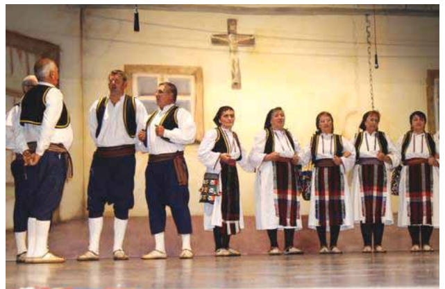
Detalj s prošlogodišnje Večeri folklor

U Velikoj dvorani Zavoda svete Obitelji na Pu-ringaju, 29. rujna, bit će održana tradicionalna Večer folklor 2012. Na ovogodišnjoj 13. po redu Večeri folklor 2012. koja se održava se u sklopu tradicionalne manifestacije „Briješka zvona“, nastupit će osam kulturno-umjetničkih društava iz Bosne i Hercegovine i Republike Hrvatske.