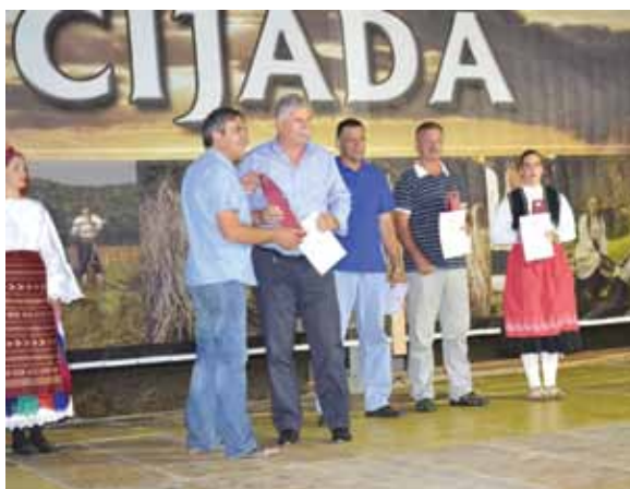
Predsjednik MZ Izbično uručuje zahvalnicu Općinskom načelniku