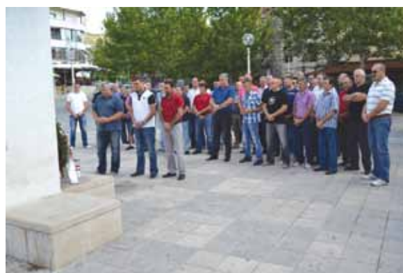
Trg širokobrijeških žrtava