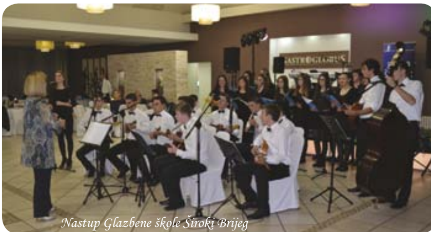
Nastup Glazbene škole Široki Brijeg

U restoranu 'Gastro Globus' u Zagrebu, 29. studenoga 2013., održano je još jedno tradicionalno okupljanje Širokobriježana i prijatelja Širokog Brijega, njihovih obitelji, te javnih osoba iz političkog, sportskog, kulturnog, gospodarskog i vjerskog života Zagreba pod nazivom 'Širokobriješka večer'. Zahvaljujući organizatorima Zavičajnoj zajednici Široki Brijeg, kao i brojnim gospodarstvenicima koji su pomogli organizaciju tradicionalne 'Širokobriješke večeri', i ovogodišnje okupljanje će ostati u trajnom sjećanju svima od preko 500 nazočnih Širokobriježana i njihovih