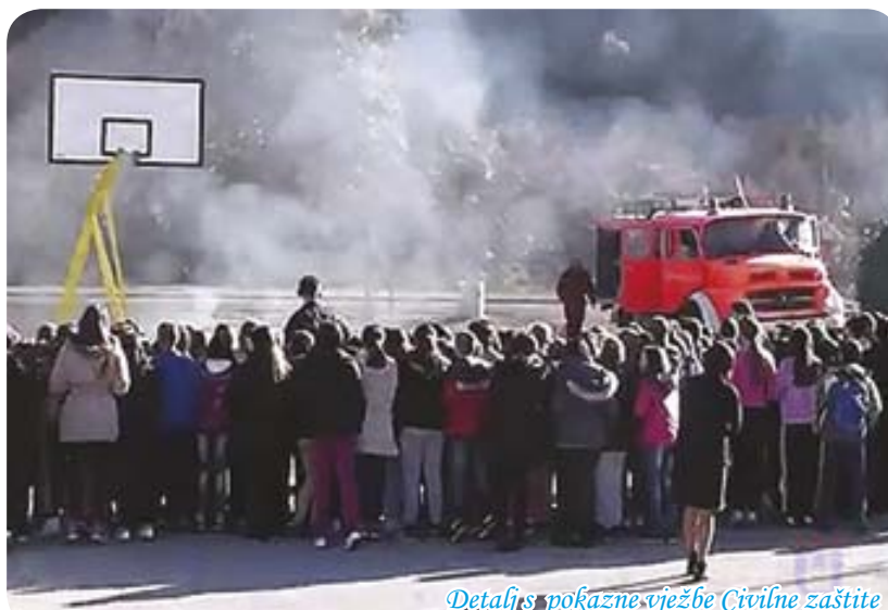
Detaljs prikaz pokazne vježbe Civilne zaštite

ispred Prve osnovne škole u Klancu, 3. prosinca 2013., održana je pokazna vježba Civilne zaštite, PU Široki Brijeg, Hitne medicinske pomoći Doma zdravlja, Vatrogasnog društva Široki Brijeg i Gorske službe spašavanja (GSS) Široki Brijeg pod nazivom „Sigurna škola“. Pokazna vježba „Sigurna škola“ je provedena u svim osnovnim školama u Županiji Zapadnohercegovačkoj u listopadu i studenom prošle godine u organizaciji Uprave civilne zaštite Županije Zapadnohercegovačke. Učenici su imali prigodu slušati predavanje o opasnostima koje im prijete tijekom boravka u kući, školi i putovanju u školu. Učenici su dobili promotivni 'ri-