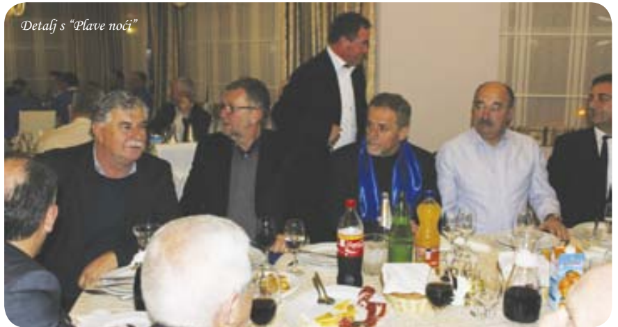
Detalj s "Plave noći"

akciju pomogli sa 5.000 KM, te ostali brojni gospodarstvenici s područja Hercegovine koji su dali svoj doprinos ovoj hvale vrijednoj humanitarnoj akciji. Najveću cijenu na aukciji postigao je dres Josipa Šimunića koji je prodan za 16.000 KM ('Proenergy' d.o.o. Mostar).