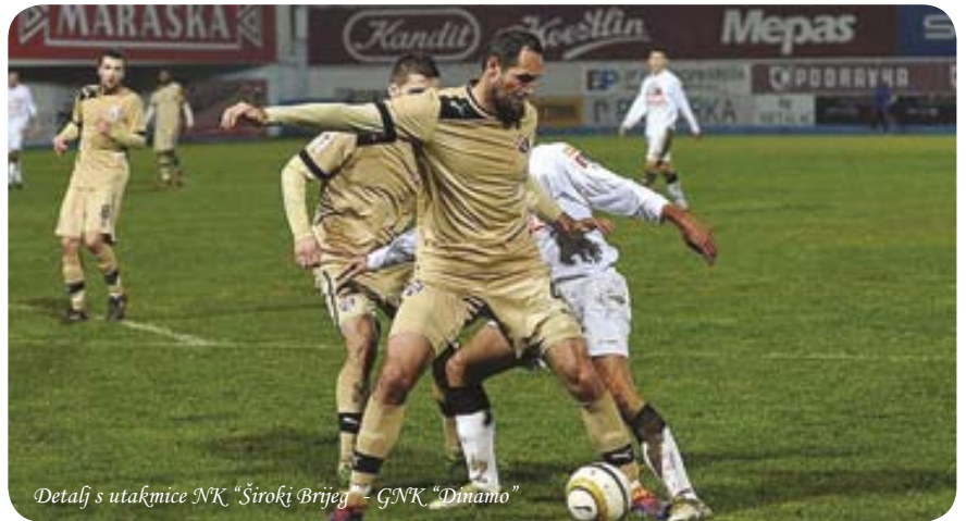
Detalj s utakmice NK "Široki Brijeg" - GNK "Dinamo"