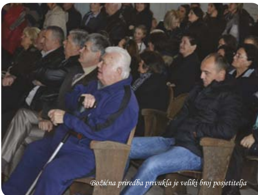
Božićna priredba privukla je veliki broj posjetitelja

gangu, bečarac i uz domaće delicije i kuhano vino koje su pripremili članovi HKUD-a Kočerin.