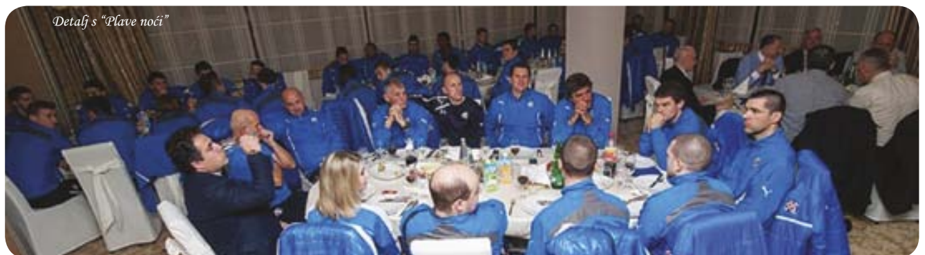
Detalj s "Plave noći"